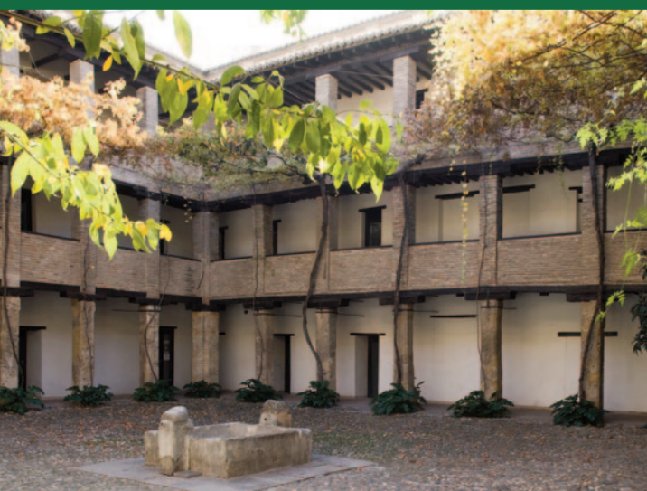
El Corral del Carbón. Sede de la Fundación Pública Andaluza El legado andalusí

Las Rutas de El legado andalusí recorren aquellos senderos que antaño fueron trazados para comunicar el Reino de Granada con el resto de al-Andalus, ofreciendo al viajero la posibilidad de disfrutar de impresionantes paisajes, viajar de forma sosegada, degustar sus delicias gastronómicas, y dejar correr la imaginación, haciendo presente el pasado.