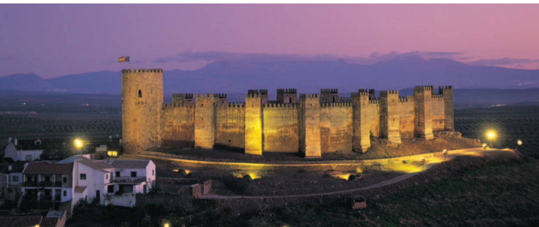
A la izquierda, el castillo de Baños de la Encina, declarado Monumento Histórico Artístico Nacional en 1934, tiene forma de barca que corona la colina, los lienzos de su muralla se levantan a intervalos por 14 torres de argamasa con almenas restauradas y una monumental torre del Homenaje con una entrada de doble arco de herradura.

Las hostilidades entre cristianos y musulmanes en el reino de al-Andalus condicionaron la organización de las ciudades y villas al cobijo de fortalezas amuralladas, junto a ríos o sobre colinas. Constanaban de uno o varios recintos de murallas, a cierta distancia del castillo, con varias torretas o atalayas. Los gruesos muros de mampostería, estaban coronados por almenas, desde las que se arrojaba todo tipo de proyectiles y se lanzaba aceite o pez hirviendo al enemigo.